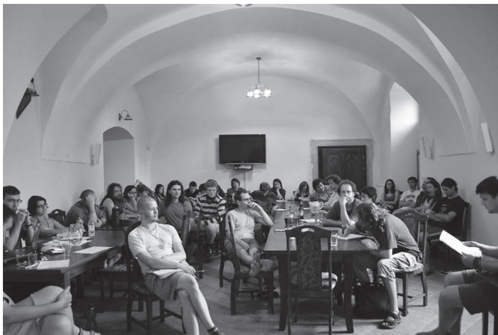
Diskuze Letní filosofické školy ve vnitřních prostorách.

z koncilových dokumentů Gaudium et spes (Radost a naděje) čteme stále více než aktuální apel na vzájemnost a solidaritu se všemi bližními: „... ať je to ode všech opuštěný starý člověk, ať nespravedlivě přehlížený pracující cizinec, ať vyhnanec, ať nemanželské dítě nezasloužené trpící za hřích, kterého se nedopustilo, ať hladovějící, který se dovolává našeho svědomí a připomíná tím slova Páně: ‚Cokoli jste udělali pro jednoho z těchto mých nejposlednějších bratrů, pro mne jste udělali,‘ (Mt 25:40).“